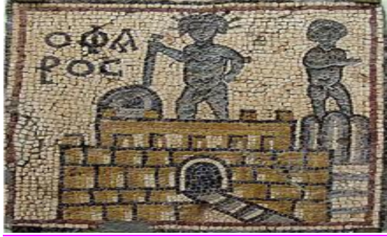
صورة منارة الإسكندرية على فسيفساء قصر ليبيا

وكان الفنار يتألف من أربعة أقسام، الأول عبارة عن قاعدة مربعة الشكل، يفتح فيها العديد من النوافذ، وبها حوالي ٣٠٠ غرفة، مجهزة لسكنى الفنيين القائمين على تشغيل المنار وأسره. أما الطابق الثاني، فكان مئمن الأضلاع، والثالث دائرياً، وأخيراً تأتي قمة الفنار، حيث يستقر الفانوس، مصدر الإضاءة في المنارة، يعلوه تمثال لإيزيس ربه الفنار ايزيس فاريا . ومن الطريف، أن اسم جزيرة فاروس "Pharos" أصبح علماً على اصطلاح منارة، أو فنار، في اللغات الأوربية، واشتقت منه كلمة فارولوجي "Pharology" للدلالة على علم الفنارات.