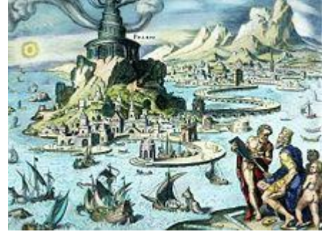
لوحة من القرن الثالث عشر